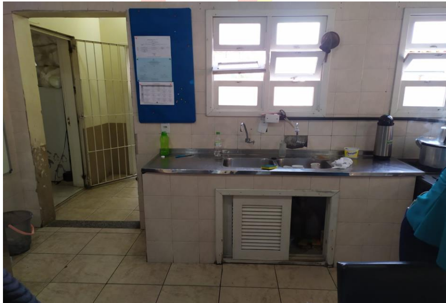
Figura 1: Atual estrutura de alvenaria para balcão.