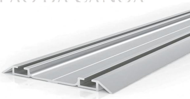
Figura 3: Modelo de trilho em alumínio (imagem meramente ilustrativa)