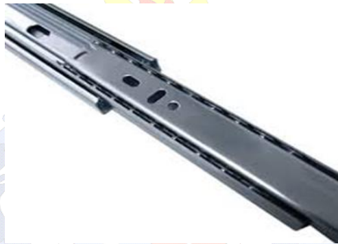
Figura 4: Modelo de trilho telescópico (imagem meramente ilustrativa)