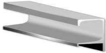
Figura 2: Modelo de puxadores em alumínio (imagem meramente ilustrativa)