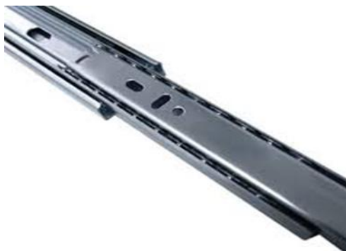
Figura 03: Modelo de trilho telescópico (imagem meramente ilustrativa)

7 - Trilhos para as gavetas: Os trilhos para as gavetas, deverão ser em alumínio padrão da imagem e do tipo telescópico, com travas que impedem a remoção total e queda das gavetas ao deslizar as gavetas (Figura 03).