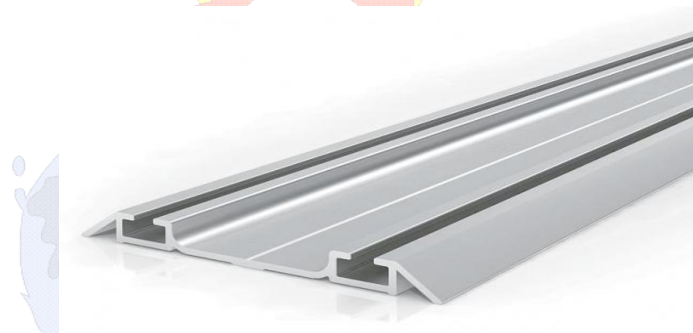
Figura 02: Modelo trilho em alumínio (imagem meramente ilustrativa)

5 – Acabamento do trilho superior e inferior: Os trilhos deverão receber um acabamento, tanto no superior quanto no inferior, em MDF 36 mm na cor Branca, nas medidas conforme o trilho. O MDF deverá ser revestido em todas as suas faces e laterais com laminado melamínico branco. As medidas exatas deverão ser conferidas no local antes da confecção.