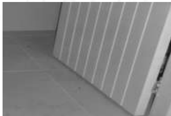
Figura 13: Modelo de porta maciça