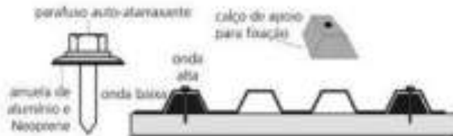
Figura 27: Detalhe da fixação do parafuso auto perforante na telha