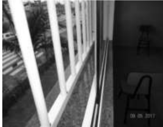
Figura 10: Modelo de janela, grade em alumínio e das pingadeiras