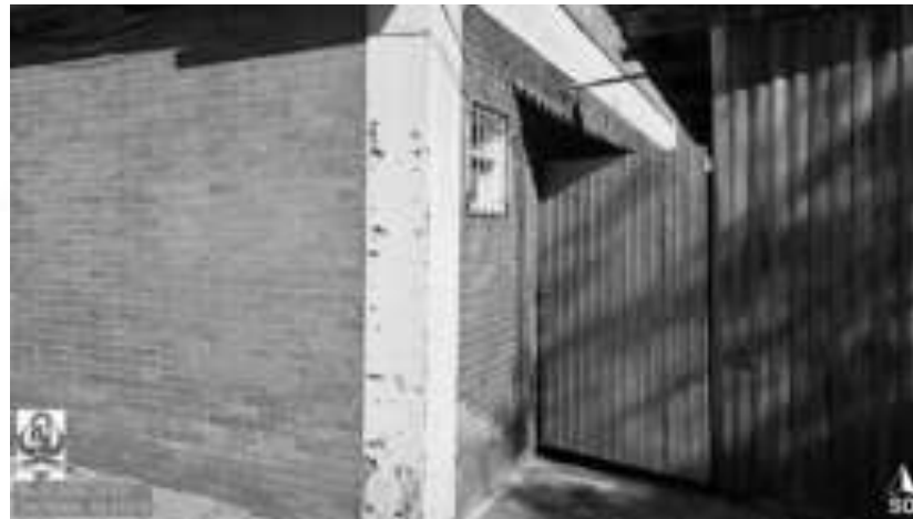
Figura 05: Detalhe da parede com plaquetas sem aderência