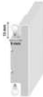
Figura 14: Detalhe do modelo do roda-meio em material poliestireno