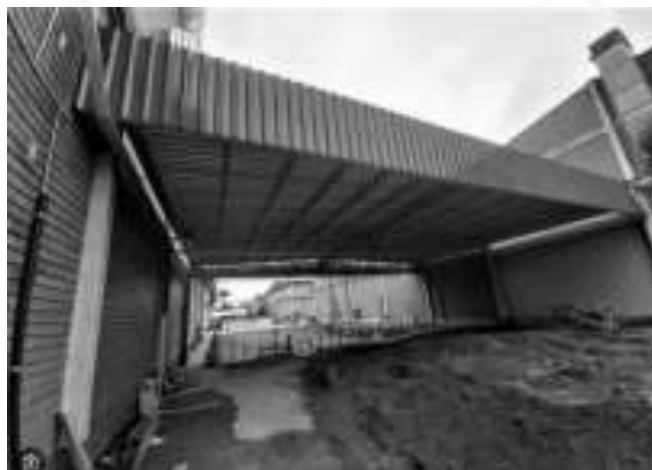
Figura 29: Detalhe do modelo de cobertura com treliças e telhas