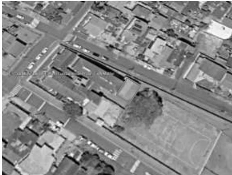
Figura 02: Projeção da área para a ampliação