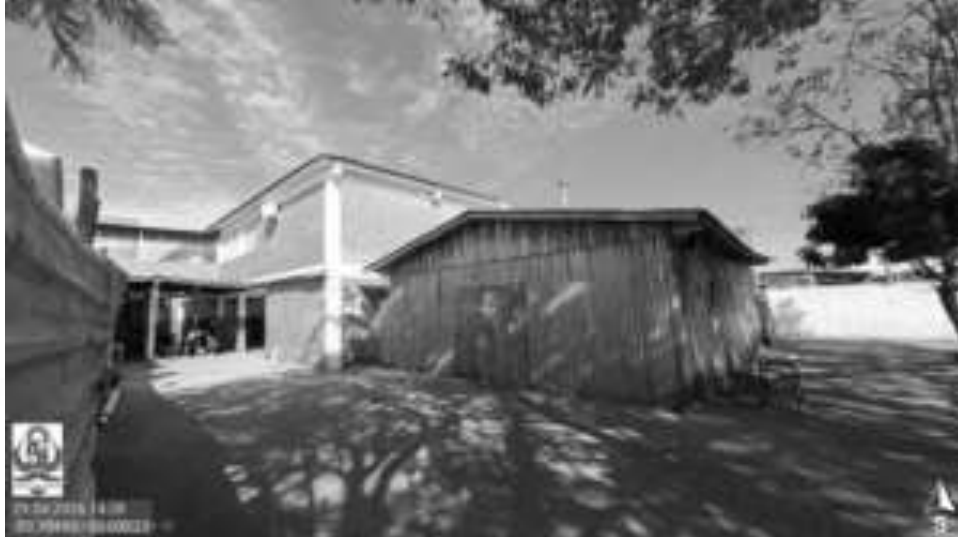
Figura 03: Detalhe do local de intervenção