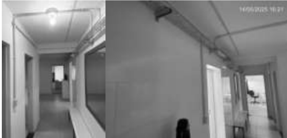
Figura 22: Derivações e saída das eletrocalhas