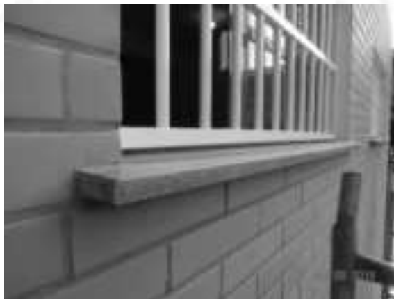
Figura 08: Detalhe da pingadeira de proteção nas laterais do vão