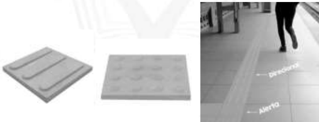
Figura 30: Modelo das placas para a execução do piso tátil

OBS.: Não será admitida a pintura das peças posteriormente a sua confecção ou instalação, devendo a tonalidade ser obtida através de pigmentação durante a fabricação das peças. (Apresentar amostra para aprovação antes da execução).