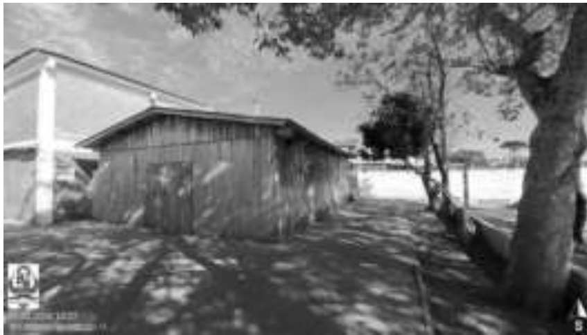
Figura 04: Local para a ampliação das novas salas