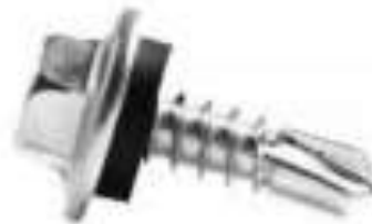
Figura 28: Detalhe do modelo de parafuso auto-perforante com arruela moldada ao corpo