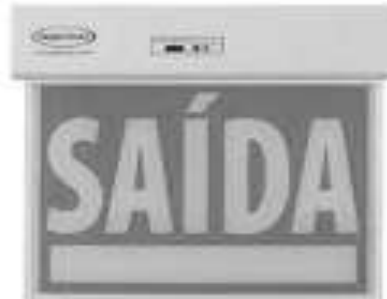
Figura 20: Modelo ilustrativo de luminária