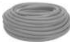
Figura 15: Eletroduto flexível de PVC corrugado reforçado (cor laranja)

Deverão ser utilizados eletrodutos de PVC flexível corrugado reforçado (cor laranja), com diâmetros de 25 mm ou 32 mm, seguindo estritamente o dimensionamento do projeto. A instalação abrange passagens embutidas em paredes e sob a laje (Figura 15).