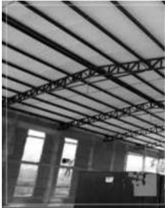
Figura 26: Detalhe do padrão da treliça galvanizada para o local e telhas