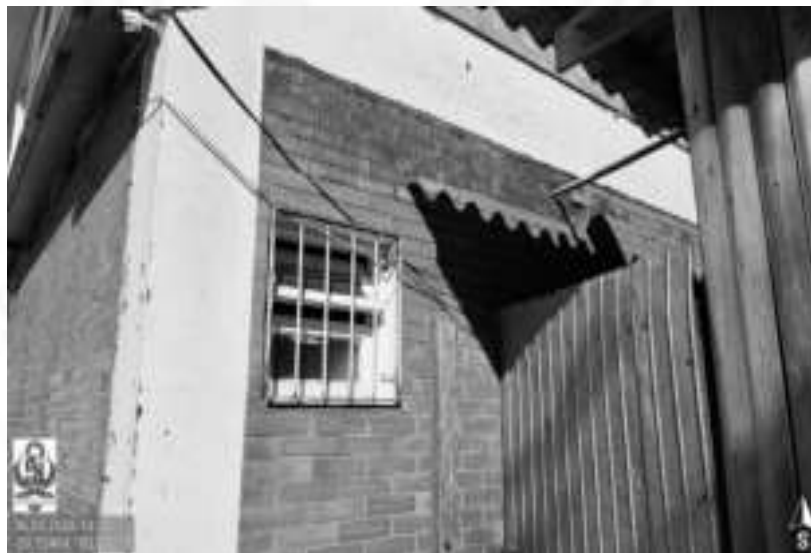
Figura 11: Detalhe de esquadria basculante