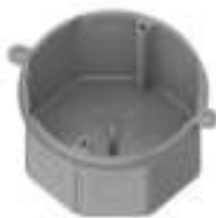
Figura 16: Caixas octogonais reforçadas de PVC (cor laranja)