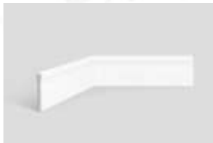
Figura 06: Detalhe do rodapé em Poliestireno