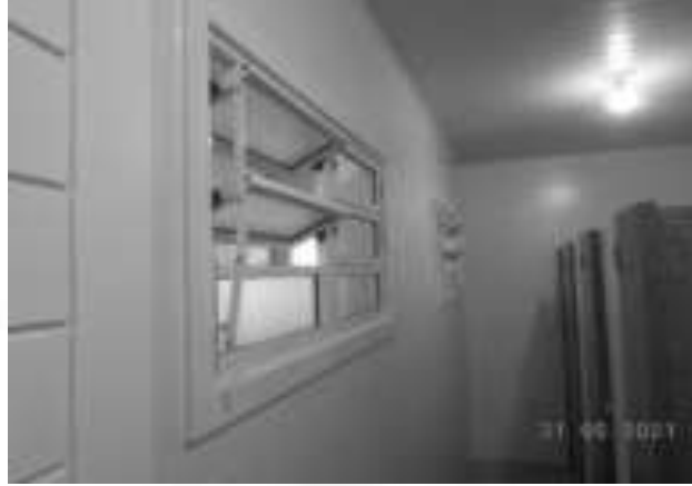
Figura 12: Detalhe de esquadria basculante