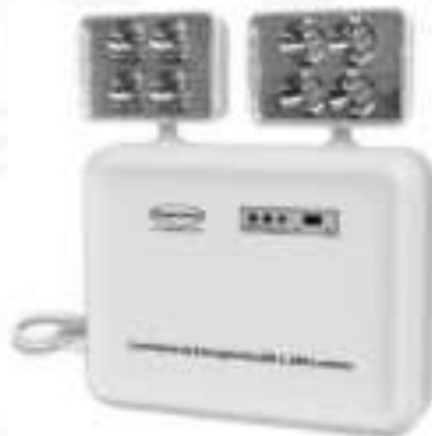
Figura 19: Modelo ilustrativo de luminária