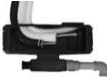
Figura 23: Modelo da caixa de espera com dreno para ar condicionado split e para as linhas