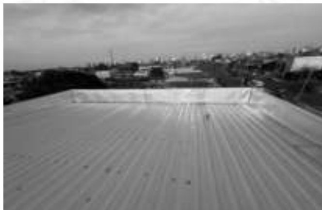
Figura 07: Detalhe da platibanda totalmente revestida (algeroz e capa)