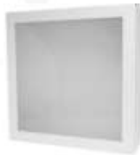
Figura 17: Luminária plafon de sobrepor de LED.

A Figura abaixo apresenta o modelo de referência para este item (Figura 17).