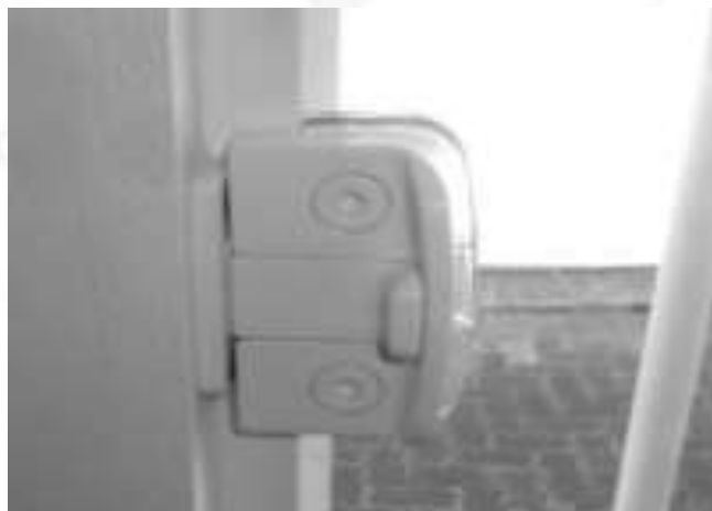
Figura 09: Detalhe do modelo de fechadura com regulagem de trava