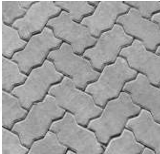
Figura 24: Modelo das peças reassentadas de bloco intertravado