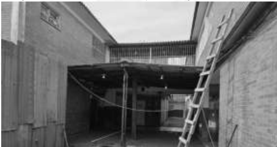
Figura 25: Cobertura a ser removida para instalação de nova cobertura