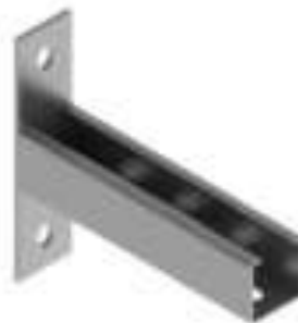
Figura 21: Mão francesa.